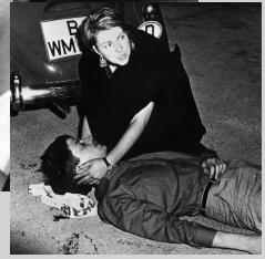
April 1967 1 2 June 1967 2