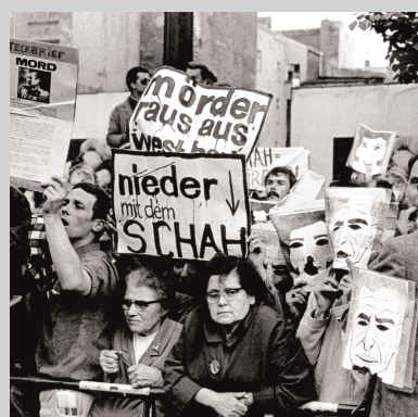
2 June 1967 5