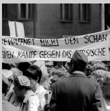
2. Juni 1967 3