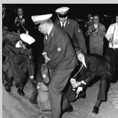
2. Juni 1967 6