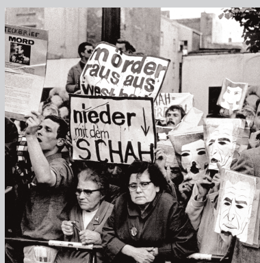
2. Juni 1967 5