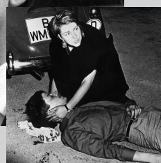
April 1967 1 2. Juni 1967 2