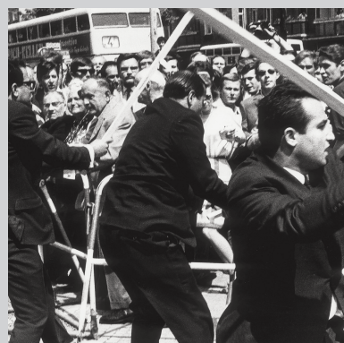
2 June 1967 4