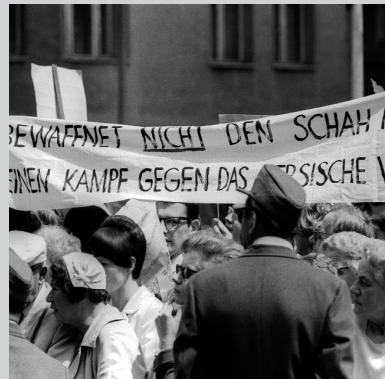
2 June 1967 3