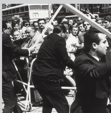
2. Juni 1967 4