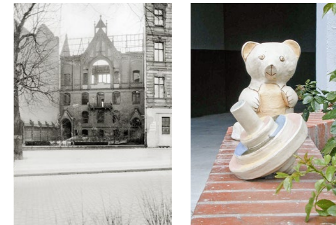
Die Ruine des Auerbach'schen Waisenhauses (links im Bild die erhaltene Mauer) und Keramikobjekte von Schülerinnen und Schülern zur Erinnerung, 2000

Nach dem Abtransport der jüdischen Zöglinge im Spätherbst 1942 nutzte die Hitlerjugend das geräumte Waisenhaus, bis es im Winter 1943 durch Bomben stark beschädigt wurde. Die Reste wurden Mitte der 1950er Jahre abgerissen. Nur ein Teil der alten Grundstücksmauer blieb erhalten.