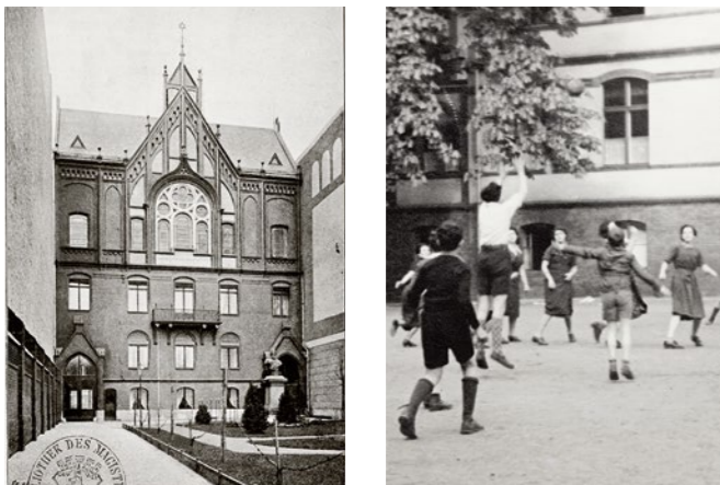
Das Portal der Baruch Auerbach'schen Waisen-Erziehungsanstalten für jüdische Knaben und Mädchen im Einweihungsjahr 1897 und Ballspiel im Innenhof nach 1936

Im Jahr 1833 gründete Baruch Auerbach (1793–1864) in der Rosenstraße ein Heim für jüdische Kinder. Sein Leitspruch war wegweisend: »Waisenkinder sind nicht arme Kinder, denen man bloß Obdach und Brot zu reichen hat. Waisenkinder sind vielmehr elternlose Kinder, die vor allem elterlicher Liebe, eines Vater- und Mutterherzens bedürfen. Darum muss das Waisenhaus, wenn es seinem wahren Zweck entsprechen soll, ein Elternhaus für Waisen sein.«